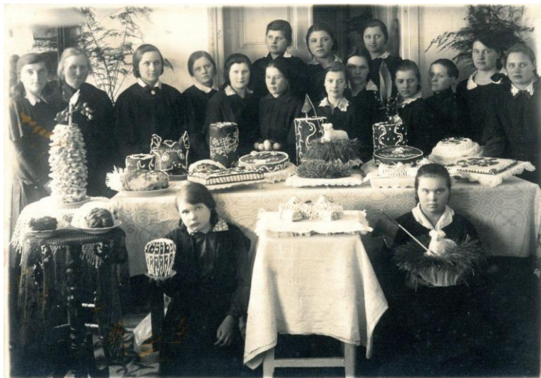
14 pav. Rokiškio mergaičių amatų ir ruošos mokyklos moksleivės. Autorius nežinomas, 1932 m., Rokiškio krašto muziejus

kad šiuose kursuose mergaitės išmokdavo kepti ir kitus JAV lietuvių vestuvėse ir kitose šventėse pamėgtus kepinius, pavyzdžiui, „Ežiukus“ ar „Beržo šaką“ (žr. 14 pav.).