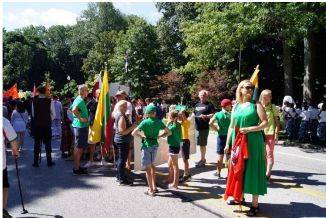
20 pav. Į „One World Day“ šventėje vykusių eiseną buvo įtraukta ir tyrėja. Autorės nuotrauka, 2022 m.

[...] Šokėjai, pasiruošę savo pasirodymui, užima vietas. Pasigirsta muzikinis įrašas. Išgirdę ausiai ir širdžiai artimus garsus, susirenka gausėnis būrelis lietuvių, stabteli pro šalį einantys smalsūs kitataučiai. Vos keli jaunosios lietuvių kartos atliekami šokiai tarsį trumpam nukelia į Lietuvą. Greta stovinti, prieš keletą dienų sutikta nauja pažįstama trečiabangė lietuvė braukia ašarą. Jaučiu, kaip ir man gerklėje stringa ašarų gumulas. [...] Šokėjų pasirodymas baigiasi. „Savų“ ir „svetimų“ žiūrovų minia išsisklaido, „Lietuvių darželiai“ vėl lieka apytuščiai. Dar kiek pastoviniavusi suprantu, kad šiame migrantams Lietuvą primenančiame žemės lopinėlyje kultūrinė programa baigėsi. [...] Atsisveikinu su tyrimo Klivlande metu sutikta nauja pažįstama trečiabange. Nors matomės tik antrą kartą ir greičiausiai niekada nebesusitiksimė, atsisveikindamos apsikabiname lyg geros draugės. Šluostydamosi ašaras ji prašo parvežti linkėjimus LIETUVAI.