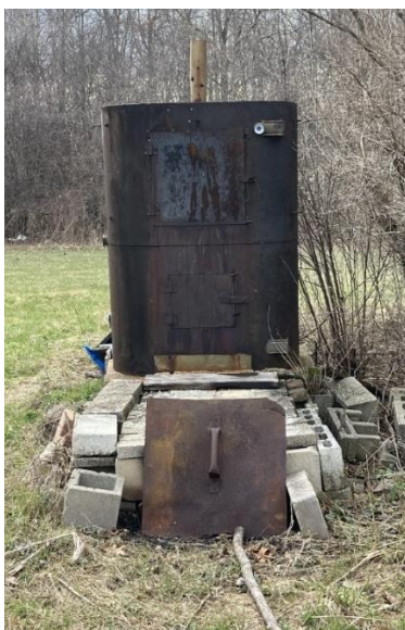
1 pav. Pateikėjos šešuro sukonstruota rūkykla. Pateikėjos nuotrauka, 2022 m.

Gyva tradicija valgyti namuose visai šeimai susėdus prie bendro stalo. Kalbinta trečios kartos pateikėja šią šeimos tradiciją išskiria kaip išimtinę JAV: