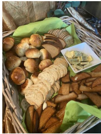
15 pav. „Lietuvių klube“ vėlyviesiems sekmadienio pusryčiams siūlomi patiekalai: šaltibarščiai, silkė su svogūnais, agurkų salotos su grietine, šviežių daržovių salotos, trijų rūšių vinigretai (du raudoni ir baltas), košeliena, dešros, kepta kiauliena, bulvių košė, cepelinai, juoda duona, bandelės su lašinukais, kepta duona su česnaku.

Panašius vėlyvuosius pusryčius su lietuviškais patiekalais „Lietuvių klubas“ rengia Motinos ir Tėvo dienos progomis 67 . Klivlando lietuviai mėgsta tokiomis progomis čia pasikviesti savo brangiausias asmenis šventinių pusryčių.