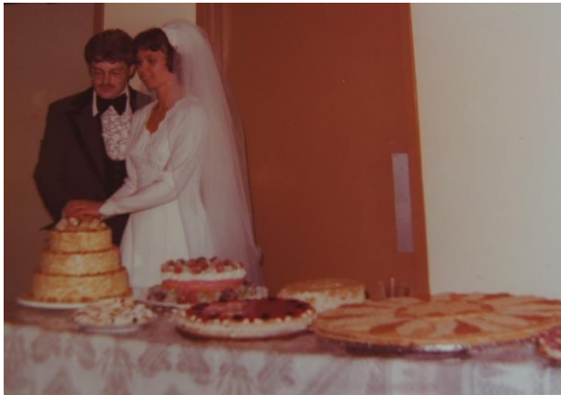
11 a pav. Lietuvių išėivių vestuvės. Tortų stalas. Pateikėjos šeimos archyvas, 1977 m. Kairėje – 3 aukštų jaunųjų tortas „Riešutinis“, centre – trys tortai be pavadinimo, dešinėje – „Napoleonas“