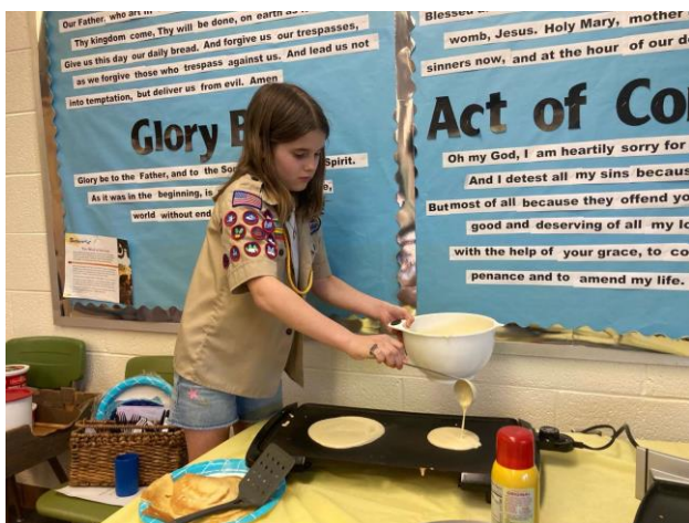
10 pav. Grand Rapidso lietuvių skautai švenčia Užgavėnės. Ketvirtos kartos lietuvė išsivė kepa blynus. Pateikėjos nuotrauka, 2023 m.

Pokariu išsivijoje stipriai šaknis įleidusi skautija aktyvi ir šiomis dienomis. Čia, siekiant jaunąsias išsivių kartas supažindinti su lietuviškomis tradicijomis, švenčiamos Užgavėnės: kepami blynai (žr. 10 pav.), gaminamos Morės. Aktyviai skautauja ir žinių apie Lietuvą ir jos tradicijas semiasi lietuvių išsivių vaikai ir anūškai. Prie jų, dalydamiesi savo žiniomis ir taip kaskart aktualizuodami lietuvybę, mielai prisideda tėvai ar net seneliai.