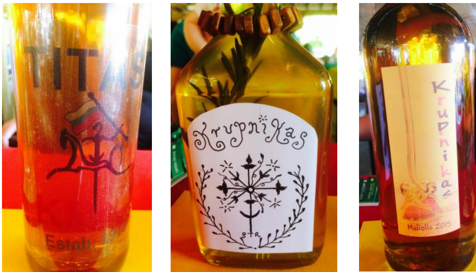
7 pav. Lietuvių išeivių gaminto krupniko etiketės. Nuotraukos šaltinis Lithuanian Club, 2015 m.

Gaminant krupniką svarbus ne tik turinys, bet ir forma – etiketė, kuria papuošiamas gėrimo butelis (žr. 7 pav.). Kaip teigia vienas iš pateikėjų: „naujas virimas – nauja istorija“ (pateikėjas Nr. 4, gim. 1948 m., K2). Tokios „istorijos“ daug ką gali atskleisti apie išeivių savivoką, pasaulėžiūrą, gyvenimo būdą.