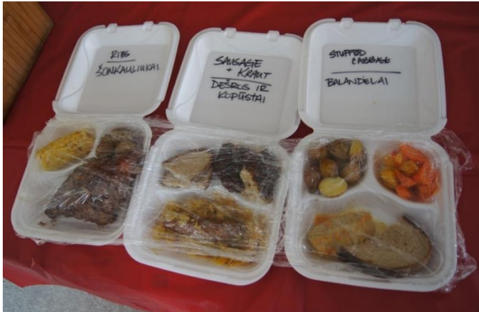
19 pav. Klivlande Lietuvių klubo piknike siūlomas lietuviškas maistas. Autorės nuotrauka, 2022 m.

Lyginant Pensilvanijoje ir Klivlande vykusių renginių, matyti akivaizdus skirtumas. „Lietuvių dienos“ buvo daugiau veiksmo, žmonės vaikščiojo nuo vieno prie kito prekybos paviljono, stebėjo veiklas, daugiau bendravo tarpusavyje. Tyrėją užkalbindavo net ir visai nepažįstami žmonės, tiesiog einantys pro šalį ar išgirdę, kad kalbama lietuviškai arba kalbama kokia nors jiems įdomia tema. O „Lietuvių klubo piknike“ didžiausias judėjimas vyko nuo maistą ir alkoholią pardavinėjančių palapinių iki eilėmis sustatytų stalų ir atgal. Šventės svečiai, dažniausiai prie stalų susėdę draugų ir šeimos būreliais, tik retais atvejais prie gretimo stalo pamatę pažįstamą prieidavo pasisveikinti ir trumpai šnektelėti. Galbūt daugiau bendrauti trukdė itin garsi muzika ir gyvai atliekamos Lietuvą po nepriklausomybės atkūrimo palikusio lietuvio dainos. Žvelgiant iš šalies, šis piknikas panašėjo į trumpą, po Klivlandą ir jo rajonus išsibarsčiusių lietuvių susitikimą, kurį papildė lietuviškai atliekamos dainos ir lietuviški patiekalai bei gėrimai.