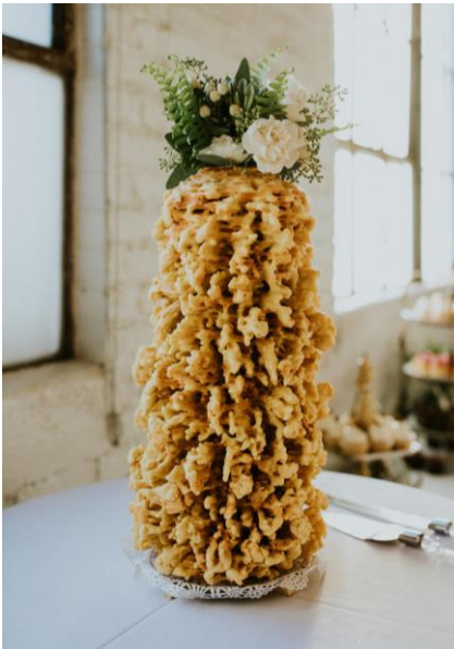
12 pav. Lietuvaičio vestuvės JAV. „Raguolis“. 2017 m.