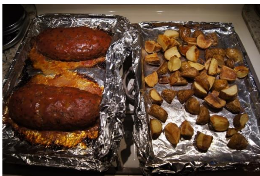
5 pav. Falšyvas zuikis iš bizono mėsos su bulvėmis. Autorės nuotrauka, 2022 m.

Trečios kartos lietuvių išeivių kasdienis maistas dar labiau paveiktas daugiataučių Jungtinių Valstijų kultūros. Šios kartos jaunimas lietuviškus patiekalus gamina labai retai, o jų lietuviško maisto racionas dažniausiai išsiskiria ne