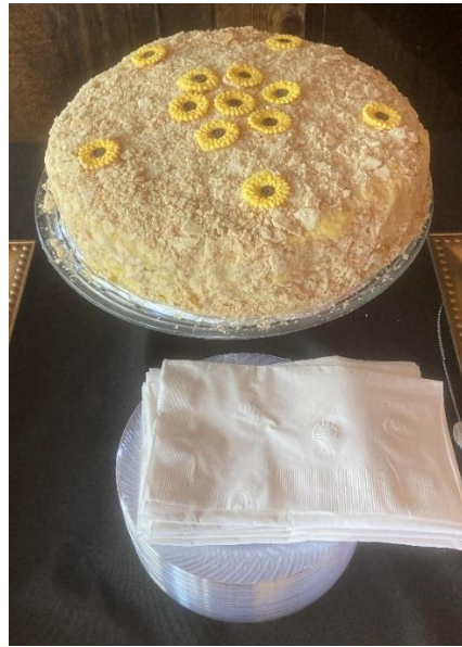
13 pav. Lietuvaitės vestuvės JAV. „Napoleonas“. Nuotraukos autorė Rėda Pliurienė, 2021 m.

Daugėjant mišrių santuokų, o į vestuves susirenkant vis daugiau nelietuvių kilmės svečių, radosi poreikis sukurti paaiškinimus kai kurioms lietuviškoms tradicijoms. Pavyzdžiui, jaunavedžių sutikimas su duona, druska ir vynu nelietuviams svečiams aiškinamas taip: