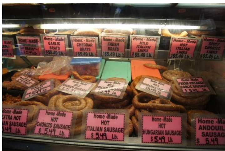
17 pav. Klivlando turguje siūlomos šviežios dešros. 2022 m.

Klivlande gyvenančių pateikėjų teigimu, „labai gerą“ juodą duoną kepa itin lietuvių mėgstama vokiečių kepyklėlė. Juodos duonos galima nusipirkti ir kai kuriose maisto prekių parduotuvėse, rytų europiečiams skirtuose skyriuose. Tačiau, pasak pateikėjų, ne visa ji skani. Šviežios dešros ar kiti mėsos gaminiai perkami Klivlando turguje (žr. 17 pav.) ir slovėnų įkurtoje mėsinėje.