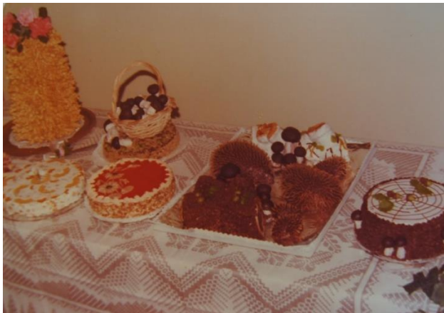
11 b pav. Lietuvių išėivių vestuvės. Tortų stalas. Pateikėjos šeimos archyvas, 1977 m. Iš kairės į dešinę: raguolis, grybukai, baltas tortas „Margas pyragas“, rausvai puoštas tortas – jo pavadinimas nežinomas. Ant stačiakampio padėklo iš viršaus į apačią: „Beržo šaka“, „Ežiukai“, „Ažuolo šaka“. Dešinėje – tortas „Kelmas“, jo viduje „Napoleonas“

Tyrimo metu pastebėta, kad tie patys tortų pavadinimai kartojasi ir kituose antros lietuvių išėivių kartos pasakojimuose. Tad galima spėti, kad išėivijoje lietuvių vestuvėse buvo susiformavęs savotiškas vestuvinių tortų „standartas“.