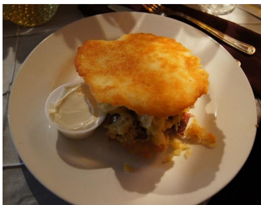
16 pav. Klivlando Lietuvių klube gaminamas „Luben Reuben“. 2022 m.

Lietuvių klube galima paragauti įdomaus patiekalo „Luben Reuben“ 68 (žr. 16 pav.). Šis patiekalas „nukopijuotas“ nuo „Reuben“ – tradicinio šiaurinės JAV dalies patiekalo – ant grotelių kepto sumuštinio, kurio ingredientai yra sūdyta jautiena, šveicariškas sūris, rauginti kopūstai ir „Tūkstančio salų“ arba „Rusiškas“ padažas. Visa tai sluoksniuojama tarp dviejų ruginės duonos riekelių. Lietuvių klube šis sumuštinis gaminamas iš jautienos kumpio, „Rokiškio“ sūrio, raugintų kopūstų, ingredientus susluoksniuojant tarp dviejų bulvinių blynų. Patiekama su grietine.