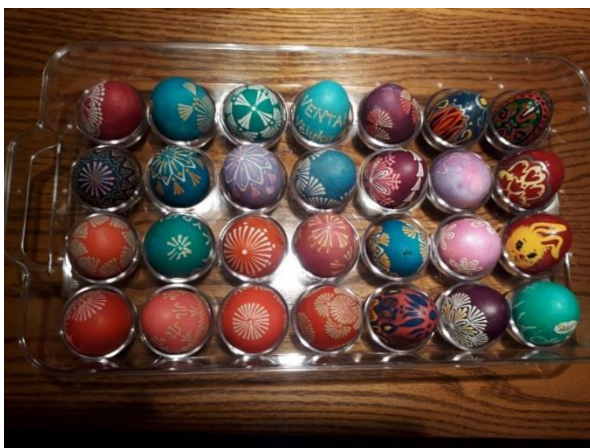
8 pav. Lietuvių išeivių dažyti margučiai.

Dažoma ne tik „lietuvišku“ būdu – svogūnų lukštais, bet ir „amerikoniškai“ – taip JAV lietuviai vadina dažymą pirktinėmis spalvomis: „[d]ažydavom margučius, bet ne lietuviškai mes dažydavom juos, ryškiom spalvom ir biškį vaško. Nežinau, mūsų nemokino tėvai ir mes tik amerikietišškai margindavom“ (pateikėja Nr. 23, gim. 1964 m., K2). Tokiu būdu dažyti margučiai dažniausiai skirti ne valgyti, o pramogoms – ridenti arba pasiliekami kaip gražus suvenyras (žr. 8 pav.). Maistui dažniau naudojami tik svogūnų lukštais dažyti margučiai. Be marginimo vašku ir žolelėmis, margučiai kartais skutinėjami. Skutinėtus margučius savo pasisakymuose dažniau minėjo vyresnės kartos pateikėjai.