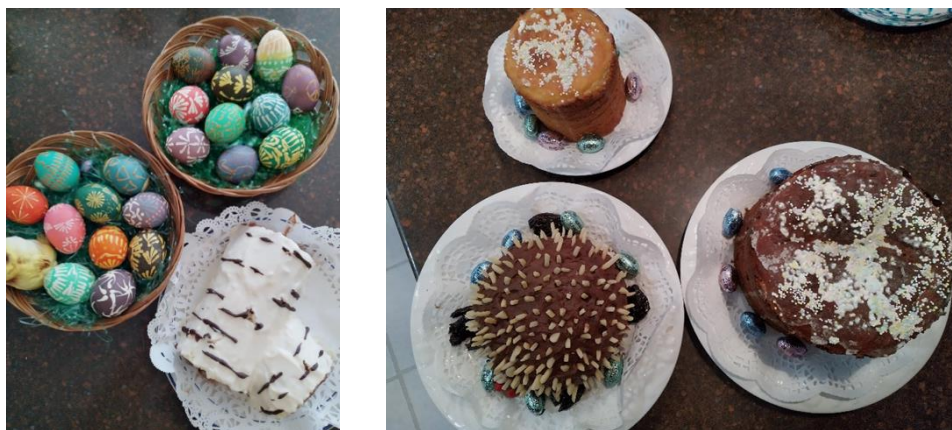
9 pav. Velykų stalo saldumynai ir margučiai. Nuotraukų autorė Audra Kubiliūtė-Daulienė, 2022, 2023 m.

Moters pateikiamas šventinių patiekalų valgiaraštis atskleidžia, kad Velykoms kepami ir saldumynai. Ne tik šiai šventei, bet ir kitomis „lietuviškoms“ progoms būdingi – „Napoleonas“, obuolių pyragas, pyragai „Avinėlis“, „Ežiukai“, „Beržo šaka“, tik Velykų stalui skirti saldėsiai – pascha ir velykinė boba arba babka (žr. 9 pav.).