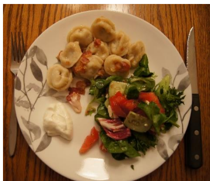
4 pav. Koldūnai su spirgučiais, grietine ir šviežių daržovių salotomis. Autorės nuotrauka, 2022 m.

maisto, o toks, pasak JAV lietuvių, ir yra lietuviškas maistas. Ieškoma „kompromisų“. Pavyzdžiui, tyrėjai lauko tyrimų metu gyvenant lietuvių šeimoje, kartą vakarienei buvo verdami koldūnai. Jie patiekti su spirgučiais, grietine ir šviežių daržovių salotomis (žr. 4 pav.). Vakarienės metu diskutuota lietuviško maisto ir sveikos mitybos tema. Šeimininkės teigimu, prie koldūnų patiekiamos salotos „todėl, kad taip sveikiau, nes koldūnai su spirgais yra sunkus maistas“ 47 . Pasakota, kad jų šeimoje ir cepelinai valgomi su salotomis (pateikėja Nr. 3, gim. 1955 m., K2). Kitą kartą vakarienei buvo kepamas falšyvas zuikis 48 iš bizono mėsos (žr. 5 pav.). Bizono mėsa vėlgi pasirinkta neatsitiktinai, o dėl mažo riebalų kiekio. Taigi, šioje kartoje lietuviško maisto gaminimas ypač derinamas su sveikos mitybos principais.