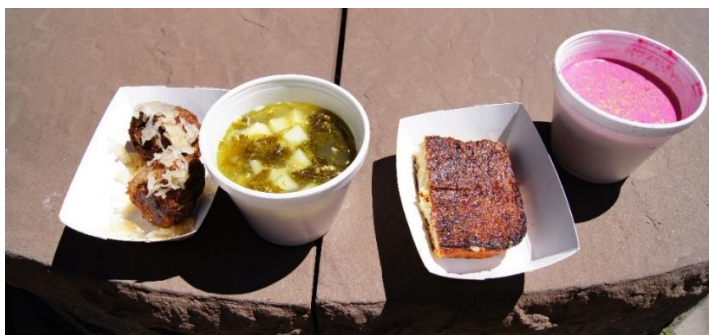
18 pav. Lietuvių dienose siūlomi patiekalai: bandukės, lapienė, kugelis, šaltibarščiai.

suaugusiesiems. Šventėje buvo prekiaujama įvairiais mažmožiais, susijusiais su Lietuva: marškinėliais su lietuviškais užrašais ir simboliais, gintariniais papuošalais, medžio dirbiniais, margučiais ir pan. Trečiosios bangos lietuviai prekiaavo šakočiais, rūkytomis dešromis, kumpiu, bandelėmis su lašinukais, lietuvišku Lietuvoje ar JAV gamintu alkoholiu. Čia pat buvo galima nusipirkti ir paragauti lietuviško maisto (žr. 18 pav.): kugelio, bandukių, dešrų su raugintais kopūstais, pateikiamų perpjautoje baltų miltų bandelėje, lapienės su špinatais 74 , šaltibarščių, raugintų kopūstų salotų, raugintų agurkų. Šaltibarščius ir kugelį gamino maistą tiekianti įmonė, kitus lietuviškus patiekalus – Lietuvos vyčių savanoriai amerikiečiai, turintys lietuviškų šaknų.