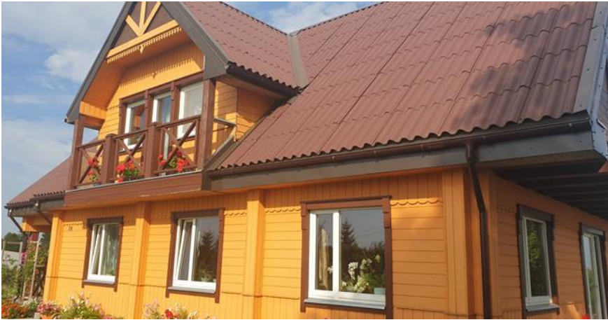
5 pav. Namas Sudervėje (Vilniaus r.). (2022 08 14).

Aptarti atvejai Baltalaukyje ir Sudervėje (Vilniaus r.), kartu su kitais, kuomet namų puošyboje panaudojami etninės architektūros elementai (plačiau skyriaus dalyje „Šiuolaikinį namą puošiantys elementai: tarp tradicionalizmo ir modernizmo“), parodo, kad šiuolaikinėje architektūroje pastebimas tradicionalizmo idėjų tęstinumas, pasiremiamas vietinės arba kitos , atitinkančios etninę, kultūrinę tapatybę, kultūros paveldu. Visa tai vyksta nepaisant arba būtent dėl plačiai paplitusio ir taikomo modernizmo principo „forma seka funkciją“. Nagrinėjamo Vilniaus arealo namų stilistikoje ryškų utilitarumo, racionalumo aspektą diktuoja ekonominės sąlygos, pavyzdžiui, aukštos nekilnojamojo turto kainos, todėl, kaip matyti iš pateiktųjų pasisakymų, namai dažnai yra statomi savomis rankomis, dėl ribotų finansų statyba ilgai užtrunka. Stilistikoje, kaip ir puošyboje, atsispindi žmogaus poreikių hierarchija – nuosavos erdvės poreikis yra svarbesnis už kuriamą stilių. Tai atitinka ir architektų išsakytą poziciją, kad individualių gyvenamųjų namų architektūroje, ypač Vilniuje ir jo apylinkėse juntamas pragmatizmas, kuris daro įtaką architektūrinei, estetinei pastato raiškai, neretai ir jos trūkumui.