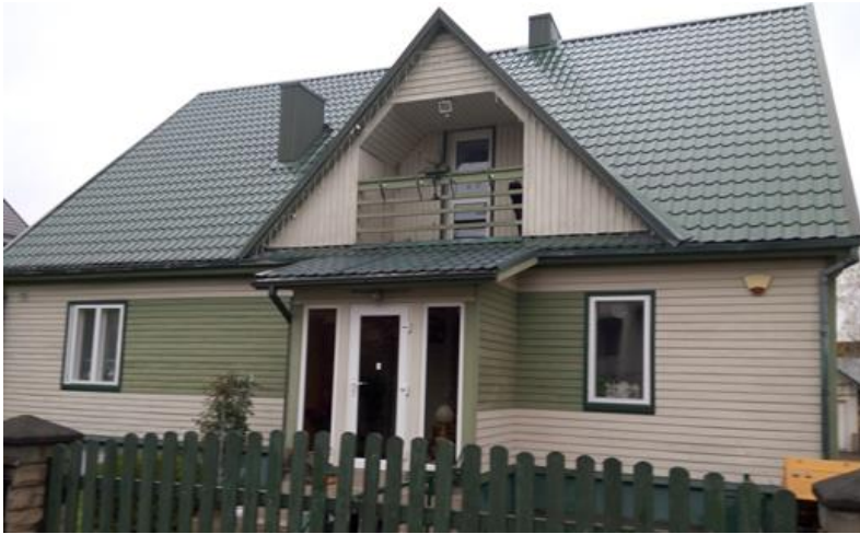
3 pav. Namas Kairėnuose (Vilniaus m.). (2016 10 28).

Ne moderniu, o klasikiniu stiliumi dėl elementaraus, patogaus išplanavimo savo namą įvardino pateikėjų pora Skirgiškėse (Vilniaus r.). Pateikėja Rasose (Vilniaus m.), kalbėdama apie savo gyvenamojo namo stilių teigė, kad siekė minimalizmo – tokio, kaip jis buvo suvokiamas tais laikais, kai statė (statybos pradžia 1993 m., didžiausi statybos darbai – nuo 2000 m., o 2007 m. įsikėlė gyventi). Vilniaus miesto ribose stovinčių pastatų savininkai dažniau minėjo modernų stilių. Pateikėja Naujaneriuose (Vilniaus m.) teigė – „sugalvotas stilius, ne gotika ir ne barokas, kažkas naujesnio tipo“. Moderniu, šiuolaikiniu savo namą įvardino ir pateikėjai Kalveliuose (Vilniaus r.). Dar vienas pateikėjas Naujaneriuose nurodė, kad nemažai laiko skyrė ieškodami patinkančio projekto, savo namo stilių įvardijo remdamasis projektavusio architekto įvardinta „dabartinio modernio atmaina, kuri turi dekoratyvinių elementų . <...> Modernas, kuris <...> daro aliuziją į, tarkim, 100 metų atgal populiarius dalykus“. Pateikėjas taip pat atkreipė dėmesį į tai, kad statybos eigoje yra nukrypstama nuo originalaus projekto: „Nuo originalaus projekto pakankamai daug viskas skyrėsi, nes statybininkai kai kuriems sprendimams architektūriniais nepritarė, <...> dėl to tas stilius keitėsi“ (g. 1975, b. B12). Kairėnuose (Vilniaus m.) pateikėjai nurodė jų namo stilių kaip skandinavišką minimalizmą, tokią stilistiką padiktavo konstrukcinis pasirinkimas – savininkas