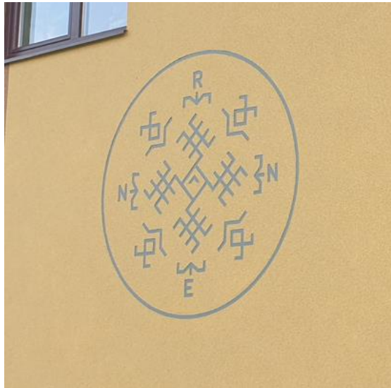
21 pav. Namų Pilypiškėse (Elektrėnų sav.) fragmentas. (2022 08 15).