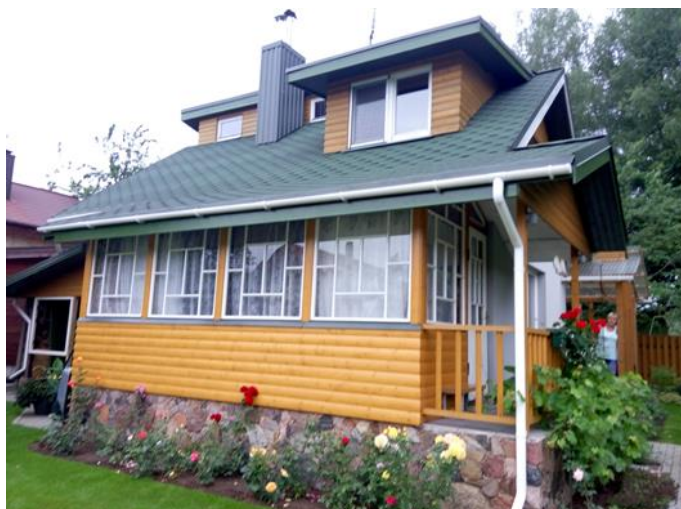
12 pav. Namu Naujaneriuose (Vilniaus m.) fasadas iš vidinio kiemo pusės.

tačiau sienomis ir langais neaptverta terasa iš tų pačių statybinių medžiagų, kaip ir pats namas buvo pristatyta Viktoriškėse (Vilniaus r.). Terasinės vietos funkciją atliko stoginė Klišabalėje (Širvintų r.), jungianti dvi atskiras namo dalis, iš vienos pusės ši konstrukcija turėjo nuo vėjo saugančią stiklo sienelę. Daug dažniau dengto tipo terasos buvo prijungiamos prie namo atskiromis, dažnai nuo namo besiskiriančiomis statybinėmis medžiagomis. Daugiausiai tokios terasos buvo statytos iš medinio karkaso (8 atvejais), turėjo vienašlaites stogo konstrukcijas ir buvo dengtos lengvomis ar permatomomis dangomis (iš plastiko arba polikarbonato). Tarp šio tipo išsiskyrė terasa Pavilnyje (Vilniaus m.), kurios stogelis buvo paremtas keliais stambiais medžio kamienais, dengta tentu su ant viršaus užpildais šiaudais. Išsiskyrė ir rąstinė terasa Kairėnuose (Vilniaus m.) su dalimi įstiklintų sienų, turėjusi dvišlaitį stogelį.