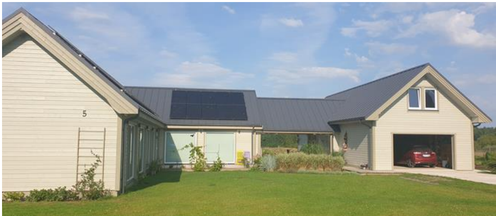
4 pav. Namas Klišabalėje (Širvintų r.). (2022 08 15).

nurodė daug metų dirbęs Skandinavijoje, statęs karkasinius namus (vyr., g. 1987). Namu savininkė taip pat akcentavo savo namo išorės paprastumą (g. 1989, b. B15). Skandinaviškam stiliui galima priskirti ir namą Klišabalėje (Širvintų r.), kurio savininkas nurodė, kad namas pastatytas pagal norvegiškus standartus. Architektūriniu požiūriu šie du namai taip pat buvo panašūs – abiejų sienų konstrukcija buvo įvardinta kaip tikras norvegiško standarto karkasas, apdaila (Kairėnuose tik dalis namo) buvo iš medžio, dvišlaitis stogas dengtas plieno danga, abu namai turėjo atviro tipo medines terasas. Vis tik pateikėjas Klišabalėje išliko šiek tiek kritiškas siedamas savo namą su skandinavišku stiliumi: pagal spalvingumą ir medžiagas galima tapatinti su skandinavišku, bet, pabrėžė, kad namai su dideliais langais ir tokia terasa Skandinavijoje nėra statomi (g. 1955 b. B25; 4 pav.).