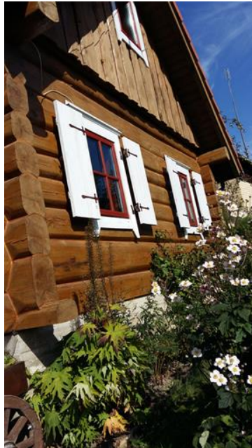
16 pav. Namu Kalikštiškėse (Vilniaus r.) fragmentas. (gauta 2016 09 05)

Langinės yra, bet kita spalva tiesiog nudažytos, nėra jokių ten, kažkokių tai tautinių motyvų, aš galvojau, nupiešti kažkada tai, kad atitiktų, galvojau, nusipiešiu langines, kažką tokio padarysiu, <...> Užsakinėjom atskirai ir kad atitiktų stilių tą, mums parodė paveikslukus, kad taip gali būti ir kaip buvo, mes žinojom, bet mes dar užsisakėm biškį pamodernintas, bet viskas iš medžio pas mus, medinis namukas (g. 1970, b. B7).