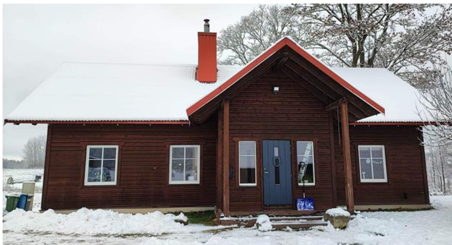
19 pav. Namu Purnuškėse (Vilniaus r.) fasadas iš vidinio kiemo pusės. (gauta 2022 11 27).

kad etninę priklausomybę atspindi tai, kad namas dengtas ne plastikine apdaila, šio namo savininkai vengė ir su kita kultūra tapatinamų elementų („buvo vengta lenkų etninės kultūros“ vyr., g. 1987, b.B22; 19 pav.). Rusų tautybės pateikėjas savo namo architektūrą siejo ne su tautine, o kultūrine tapatybe. Savo namo architektūrą, remdamasis kaimynų reakcijomis, pateikėjas įvardino kaip nestandartišką , turinčia, Indonezijos bruožų, kurie aplinkinius ir domina ir „gąsdina, kad už to stovi kažkoks religinis ar sektantinis aspektas“ (g. 1977, b. B26).