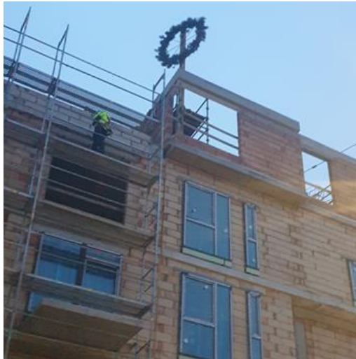
22 pav. Pabaigtuvių vainikas ant statomo daugiabučio Paupio g. (Vilniaus m.).

Tai yra šventės simbolis, tai yra šventė, nu kaip, vainikas, sportininkai grįžta iš varžybų, deda vainikus, ant kaklo kabina, šlovės simbolis (vyr., 63 m.); Pastatą pastatyti – tai didelis darbas (vyr., 56 m., b. C2).