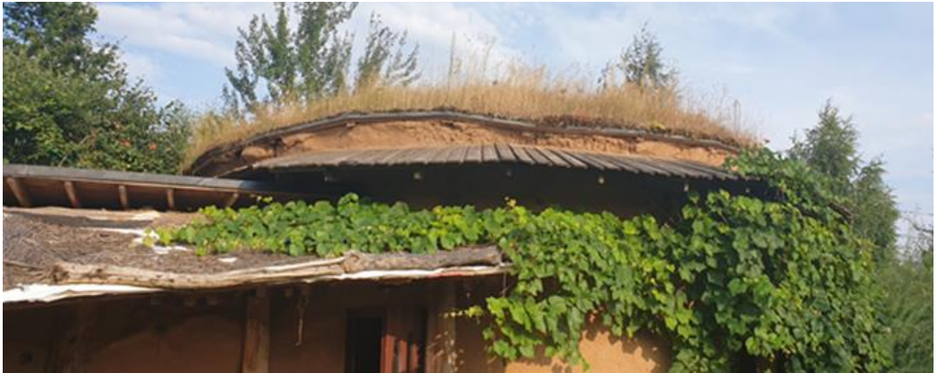
11 pav. Šiaudų ir molio namo Pavilnyje (Vilniaus m.) želdinto stogo fragmentas.