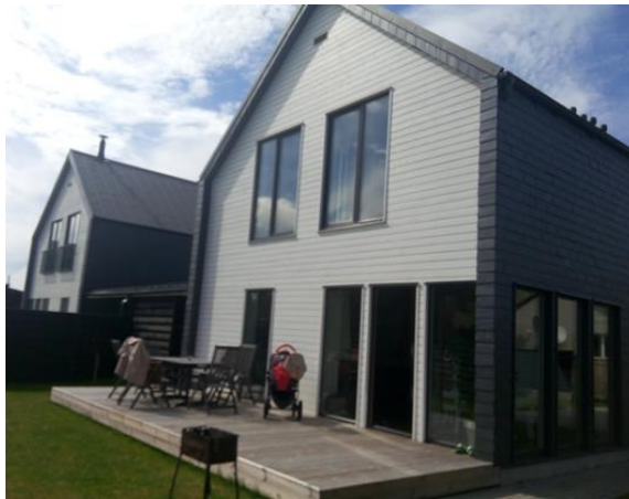
13 pav. Namų Kairėnuose (Vilniaus m.) fasadas iš vidinio kiemo pusės.

terasa, nuo kurios atsiveria toli siekiantis vaizdas į gamtą, buvo įrengta, jau paminėta, nuo lietaus ir vėjo sauganti, du namo galus jungianti stoginė su stikline pertvara. Pasitaikė daugiau atvejų, kuomet prie namo įrengiamos kelios terasinę funkciją atliekančios vietos, pavyzdžiui, įstiklintos verandos tipo terasa vidinėje kiemo pusėje ir nuo gatvės iš medžio karkaso ir stogeliu dengta terasa-prieangis buvo įrengta Naujaneriuose (Vilniaus m.), panašios terasos – viena uždaresnė, kita atviresnė, su vaizdu į ežerą buvo įrengtos Danilavoje (Vilniaus r.).