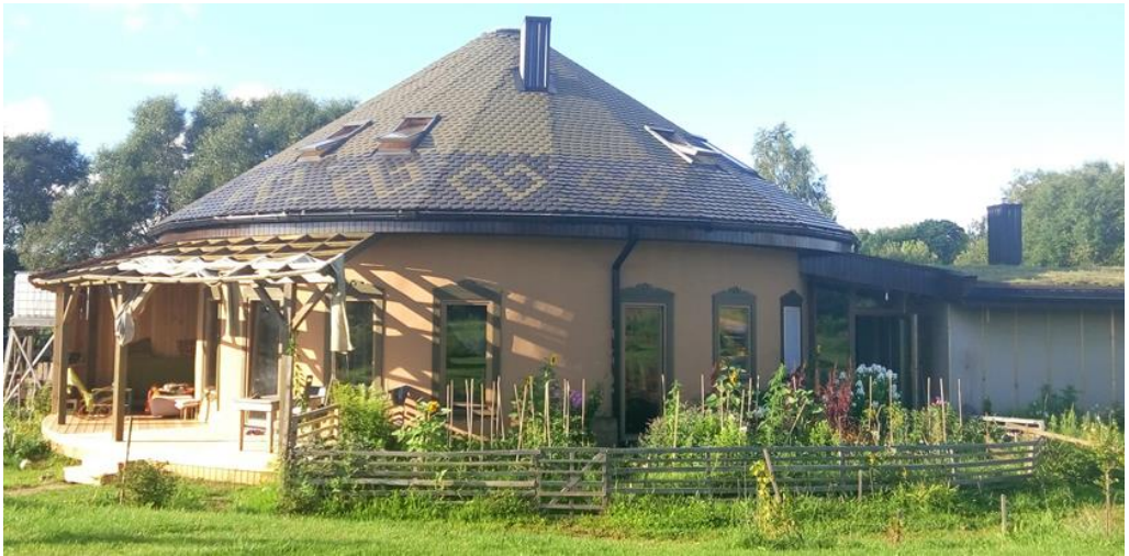
18 pav. Namas Pakalniškėse (Širvintų r.). (2016 08 03).

Šoniniame fasade buvo pasirinktas Pasaulio medis, o vidinio kiemo pusėje namą ties sienos viduriu puošė iš baltiškų ženklų sudėliotas apskritimo pavidalo simbolis su Aukščiausiojo dievo simboliu jo viduryje ir šeimos narių pirmomis vardo raidėmis jo išorėje.