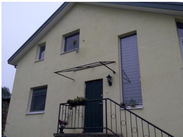
17 pav. Namas Kairėnuose (Vilniaus m.). (2016 10 14).

apkalto medinėmis lentelėmis medžio puošyba. Pateikėja prie puošybos priskyrė ant pastogės karnizo užapvalintų lentų pakalimo pieštą ornamentą, kurį sugalvojo ir pagal trafaretą padarė pateikėjos sutuoktinis. Namui buvo būdingi ir daugiau medinėje, ne tik miesto, bet ir kaimo statyboje sutinkami puošybos elementai, kuriuos gamino namo savininkas, pateikėjos teigimu, stalius-mėgėjas , nors prie puošybos pati pateikėja jų neįvardino – tai medinės rombo pavidalo durys, mediniai profiliuotų lentų langų ir durų apvadai, balkono tvorelė su šiek tiek profiliuotais stulpais bei pastogės kryžmos, puoštos dantyto ornamento pakalimu. Puošybos elementai artimesni medinei miesto architektūrai, turi panašumų su Zakopinės stiliumi, nors pati namo forma ir proporcijos būdingos vietinei architektūrai.