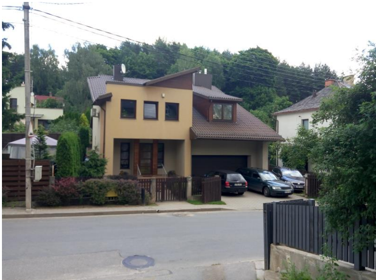
2 pav. Namas Rasose (Vilniaus m.).