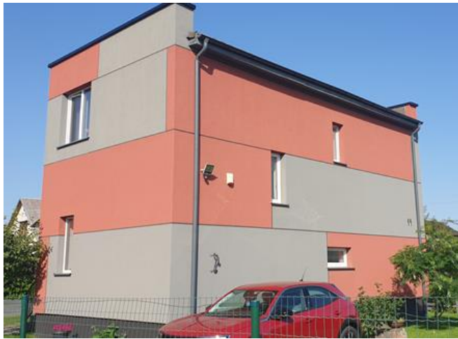
7 pav. Namas Kalveliuose (Vilniaus r.). (2022 07 22).

toks apkalimo būdas „atsineštas“ iš Suvalkijos, iš kurios buvo kilęs namo savininkas, šio regiono architektūroje buvo paplitusi tiek vertikali, tiek horizontali fasado iš medžio lentų apdaila, nors tarp iš Žemaitijos, kur toks sienų apkalimo būdas buvo taip pat paplitęs, kilusių pateikėjų namų toks sienų apkalimo būdas nepasitaikė. Tarp mūrinių namų, apkaltų medinėmis lentomis išsiskyrė ir namas Paliuliškėse (Vilniaus r.), kuris buvo apkaltas medžio lentomis su užlaidomis (lentas dedant vieną ant kitos šiek tiek jas užleidžiant).