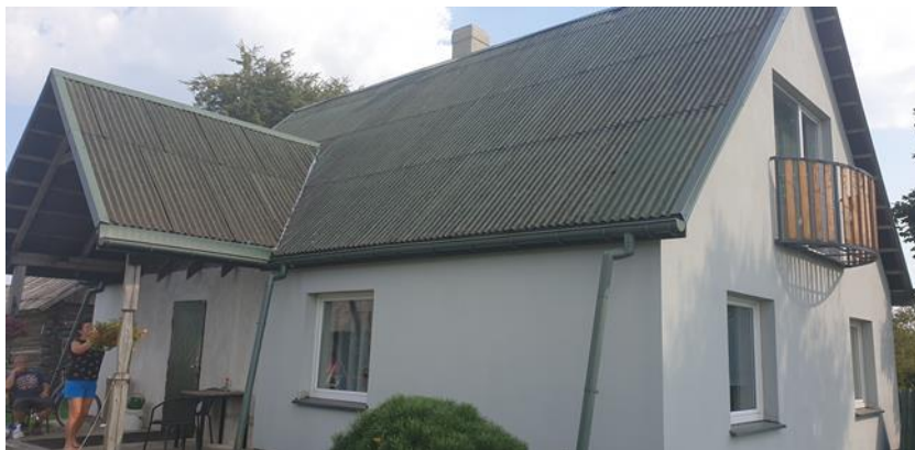
14 pav. Namas Senajame Tarpupyje (Trakų r.).