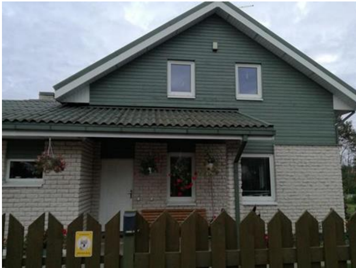
9 pav. Namas Kryžiukuose (Vilniaus m.). (2016 09 18)