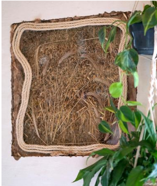
23 pav. „Teisybės langas“. (žiūrėta 2023 02 27).