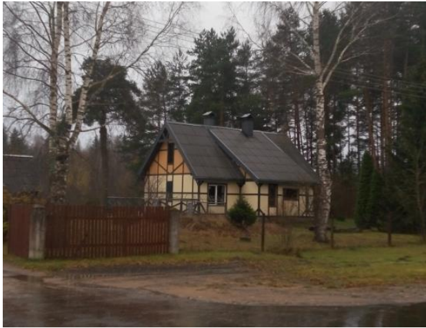
20 pav. Namas Baltalaukyje (Vilniaus r.). (2016 10 31).

Pateikėja išvardino ir svarbiausius, etniškumą name parodančius elementus – gonkas (galerijos tipo prieangį), langines, medžio žaliavą, tačiau teigė tokį namą pasirinkusi, visų pirma, dėl estetinių priežasčių, ne dėl sąsajų su aukštaitiškumu (g. 1970, b. B7). Šiuo atveju estetikos svarbą pagrindžia ir tai, kad pateikėja vartojo, greičiausiai iš pardavėjų perimtą, klaidingą trobos terminą. Tyrime tradicionalizmui, išrastai tradicijai (Hobsbawm 2000[1983]: 1) priskirtų puošybos elementų (pavyzdžiui, langinių, antlangių) pateikėjai nebuvo linkę priskirti prie tapatumą parodančių simbolių, nors įvardino jų kilmę kaip paimtų iš lietuvių etninės kultūros („paimtos iš tradicinės lietuvių statybos“ vyr., g. 1976, b. B1; „pagal etnografinius regionus“ vyr., g. 1991, b. B4; „pagal lietuviškų ornamentų knygą“ vyr., g. 1979, b. B14).