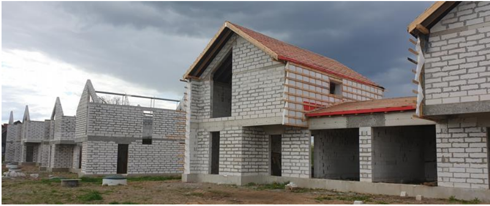
10 pav. Statomas individualių sublokuotų namų sutapdintais stogais kvartalas Gulbinėliuose (Vilniaus m.). (2022 05 15).