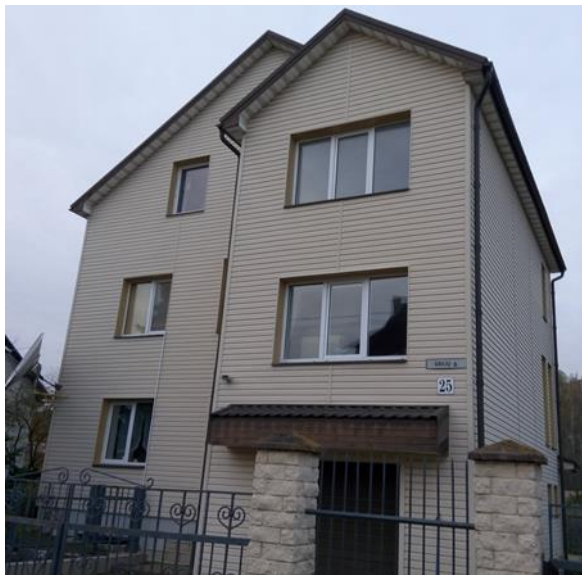
8 pav. Namas Kairėnuose (Vilniaus m.). (2016 10 27).

apylinkes pastebima nemažai, ypač tarp namų, kurie yra statomi nekilnojamo turto vystytojų. Tokioje statyboje neretai klinkeris dedamas dalimis, taip pagražinamos, pajavirinamos tinkuoto namo dalys, pavyzdžiui, ties įėjimo į namą vieta ar tarpai tarp langų. Tyrimų metu apklausta viena namo, kurio apdaila buvo kombinuota iš klinkerio ir medžio lentų, savininkė Rūdiškėse (Trakų r.), kuri pasakojo apie pastovią medinės dalies apdailos priežiūrą. Pateikė akcentavo, kad, priešingai nei pirmo aukšto klinkerio apdaila, kuria rūpintis nereikia, medinis ertikis, po namo pastatymo 2009 m., jau buvęs perdažytas. Imlumą nuolatinei priežiūrai ir aukštą kainą apklaustieji architektai taip pat priskyrė prie didžiausių medienos kaip apdailinės medžiagos trūkumų.