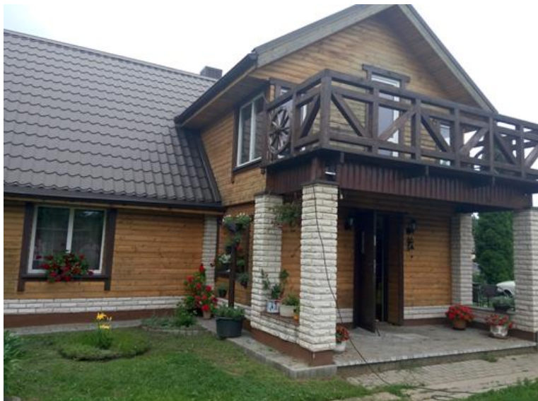
6 pav. Namas Skirgiškėse (Vilniaus r.). (2016 07 12).

tokiame name „žiemą yra šilčiau, vasarą yra vėsu – mediniam va tas yra privalumas, prioritetas prieš mūrą. Ir dar kas – medinis yra erdvės didesnės, mažas atrodo namas – didžiausia erdvė“ (sutuoktinis g. 1949, b. B21). Mūrinių namų su mediniu priešino ir kitas mediniame name gyvenantis pateikėjas – „nesinorėtų to plytų mūro“ (g. 1991, b. B4).