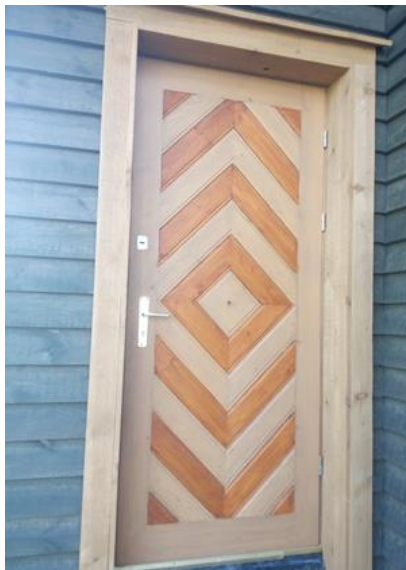
15 pav. Namu Paliuliškėse (Vilniaus r.) lauko durys. (2016 06 22).