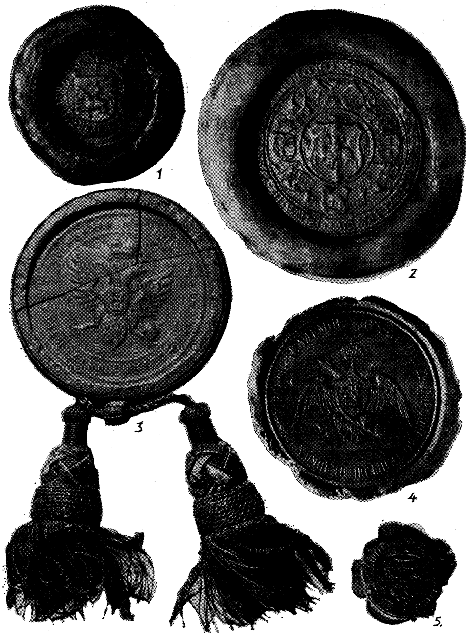
2 pav. Antspaudai: 1—Lietuvos didžiojo kunigaikščio Aleksandro (1492—1506), 2—LDK didysis, Zygmanto Senojo laikų (1506—1548), 3—Vilniaus imperatoriškojo universiteto (1803—1832), 4—Vilniaus imperatoriškosios medicinos-chirurgijos akademijos (1832—1842), 5—Vilniaus katedros kapitulos (XVIII a. pab.—XX a. pr.). Visi antspaudai sumažinti \frac{3}{5}