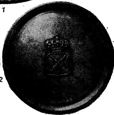
4 pav. Antspaudai: 1 — Sventosios Romos (Vokietijos) imperijos didysis (nuo 1658), 2 — Krokuvos Jogailos universiteto didysis (1400—1655) ir jo dangtis su rektorių herbu (greičiausiai — XVI—XVII a.). Abu antspaudai sumažinti \frac{3}{5} .