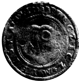
Minsko miesto rašmeninis antspaudas, 1584 m.

Lenkiška legenda *PIECZECZ *MIEISKA · MIINS (Minsko miesto antspaudas) įrašyta palei antspaudo kraštą, tarp dviejų linijinių aprėminimų. Legenda pradedama, atrodo, šešialapiu žiedeliu, toks pat skirtukas padėtas po pirmojo žodžio, po antroju – trilapis. Paskutinysis žodis MIINS išraižytas daug prasčiau, be to, tarsi uždėtas ant augalinių motyvų ornamentų.