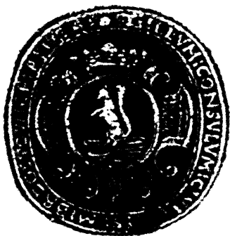
Didžiosios Bžostovicos miesto tarėjų herbinis antspaudas, [apie 1754–1842 m.]

Apie savivaldos darbą nėra duomenų, nors ji, kaip rodo vėlesnė medžiaga, buvo įkurta ir turėjo veikti. Po trečiojo valstybės padalijimo 1795 m. Didžioji Bžostovica atsidūrė Rusijos Imperijos sudėtyje. 1797 m. pateikta įrašyti į Gardino miesto aktus