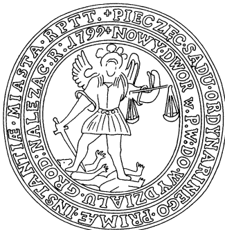
Naujadvario miesto pirmosios instancijos ordinarinio teismo spaudos piešinys, 1792 m.

Žinomas vienas spaudas iš Ketverių metų seimo laikotarpio. Jis reprezentuoja miesto teisumą. Nors šis antspaudas skelbtas, dėl aiškumo, kadangi priklauso kitam miestui, skelbiame dar kartą.