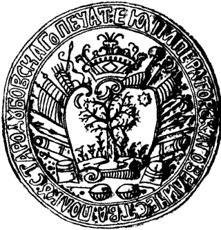
Starodubo pulko antspaudas, naudotas 1766–1772 m.