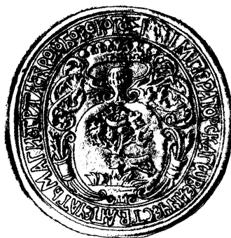
Starodubo magistrato herbinis antspaudas, 1762 m.

Suprantama, daug svarbesnis Lietuvos Didžiosios Kunigaikštystės miestų sfragistikai neseniai surastas 1762 m. Starodubo magistrato antspaudas.