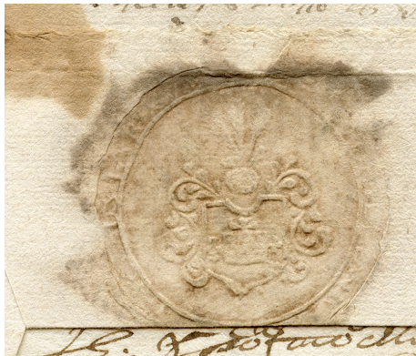
6 pav. Teodoro Bilevičiaus antspaudas, 1691, LMAVB RS, f. 37, b. 9597, l. 4r