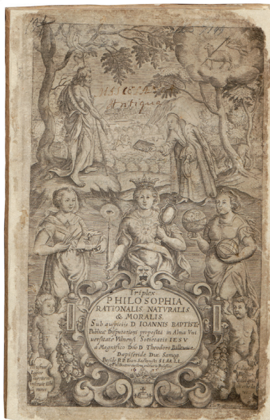
7 pav. Aleksandro Tarasevičiaus vario graviūra su Teodoro Bilevičiaus herbu, 1675, VUB Retų spaudinių skyrius, šifras: III 14771.

tačiau ji neišliko 54 (6 pav.). T. Bilevičiaus herbas pavaizduotas Aleksandro Tarasevičiaus 1675 m. vario graviūroje 55 . Tiesa, Bilevičiaus herbas nedidelis, jį užgožia pirmojoje graviūros dalyje matomos trys filosofijos alegorijos, stovinčios prie barokiškų formų kartušo su įkomponuotu knygos pavadinimu. Pastarąjį laiko dvi angelų figūros 56 (7 pav.). XVII a. pabaigoje savo antspauduose Bilevičių giminės herbą naudojo ir Steponas Bilevičius 57 .