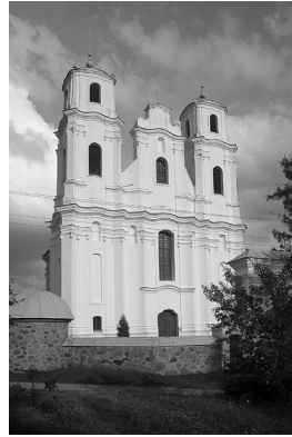
9. Piedrujos Šv. Mergelės Marijos Dangun Ėmimo bažnyčia

Lietuvos architektūros istoriografijoje, kalbant apie šios pakraipos įtaką architektūros raidai ir tendencijoms, įprastai konstatuojama, jog Vilniaus baroko mokyklai būdinga stilistika paplito po visą Lietuvos Didžiąją Kunigaikštystę, tarsi savaimė sklido lyg vandens ratilai – vienodu intervalu ir didėjančiu spinduliu apimdama vis platesnę teritoriją. Tačiau statybos ir apdailos madas „pernešė“ ir platino architektai bei apipavidalintojai, formavo užsakovų poreikiai, ekonominės galios.