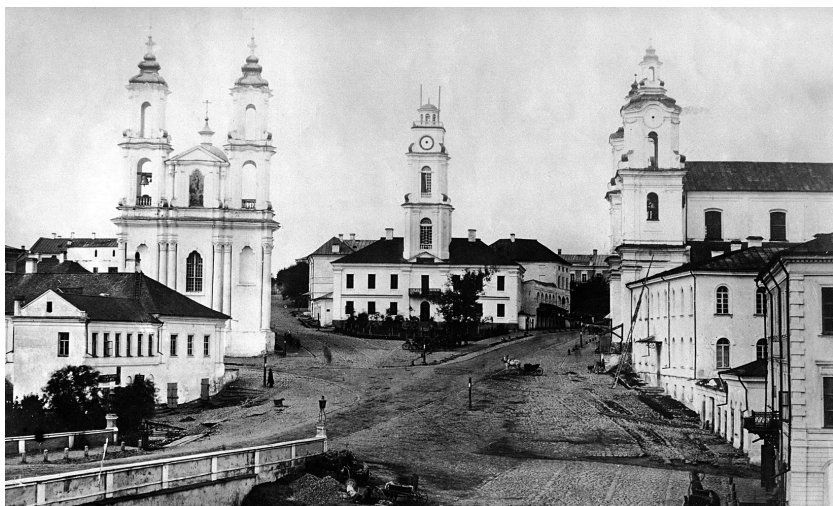
13. Vitebsko rotušės aikštė. Kairėje – unitų Kristaus Prisikėlimo cerkvė, dešinėje – bernardinų Šv. Antano bažnyčia. 1867 m.

Antra priežastis – ilgamečių darbo santykių su užsakovais (valdančiuoju elitu, aukščiausio rango dvasininkais) palaikymas, taip pat Lietuvos Didžiosios Kunigaikštystės žemėlapyje braižęs Vilniaus baroko mokyklos sklaidimo kryptis. Statybų trukmė ir užsakymų skaičius (architektai sulaukdavo kelių ar keliolikos to paties užsakovo užsakymų) darė įtaką šių santykių tęstinumui.