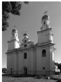
19. Talačyno Dievo Motinos Globos cerkvė