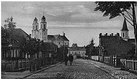
11. Ilūkstės jėzuitų Švč. Jėzaus, Marijos ir Juozapo bažnyčia. XX a. pr. Atvirutė

kondensavosi tai, kas Vilniaus aplinkoje ir meno apyvarčioje buvusį dailės ir architektūros stilių darė mokykla .