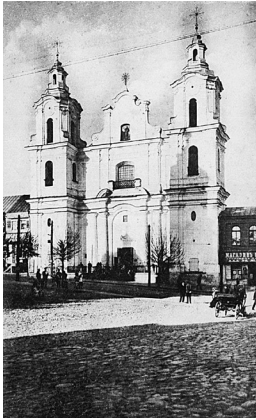
1. Vitebsko Šv. Antano bažnyčia. XIX a. pab.