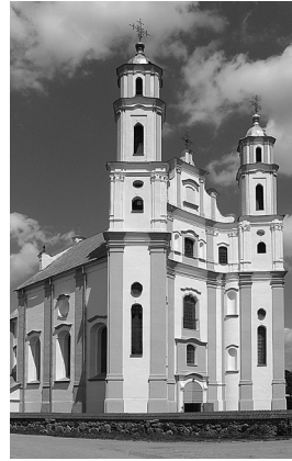
3. Lužkų pijorų Šv. Mykolo Arkangelo bažnyčia

Tai tokie garsūs vėlyvojo baroko architektūros paminklai kaip Pasienės dominikonų Šv. Dominyko, Piedrujos Švč. Mergelės Marijos Dangun Ėmimo, Vilianų (lenk. Wielony , latv. Viļāni ) bernardinų Šv. Mykolo Arkangelo, Agluonos dominikonų Švč. Mergelės Marijos Dangun Ėmimo, Gluboko basųjų karmelitų Švč. Mergelės Marijos Dangun Ėmimo ir parapinė Švč. Trejybės bažnyčios, Polocko unitų Šv. Sofijos katedra, Smalėnų dominikonų Švč. Mergelės Marijos bažnyčia, Talačyno bazilijonų Švč. Dievo Motinos Globėjos cerkvė, Armanavičių Viešpaties Atsimainymo, Sieliščių