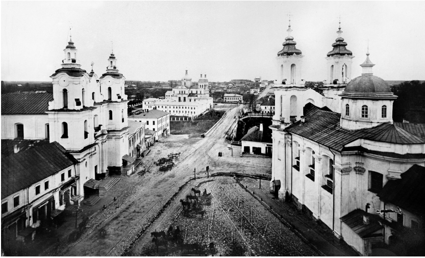
12. Vitebsko rotušės aikštės vaizdas žvelgiant iš rotušės varpinės. Dešinėje – unitų Kristaus Prisikėlimo cerkvė, kairėje – bernardinų Šv. Antano bažnyčia. 1860 m.

Užsakovų ambicijos ir finansinis įgalumas skatino ieškotis profesionalių atlikėjų sostinėje. Dauguvos ir Dniepro baseino su jo intakais teritorija atliko žymų vaidmenį Lietuvos Didžiosios Kunigaikštystės kultūriniam ir ūkiniame gyvenime. Čia driekėsi svarbūs prekybai tranzitiniai sausumos ir vandens keliai, jungę likusią Abiejų Tautų Respublikos dalį su Livonija (lenk. Inflanty ) ir Rusija, augo prekybos ir amatų miestai (Polockas, Vitebskas, Mogiliavas, Orša, Mstislavlis), kuriuose koncentravosi reikšmingas ekonominis potencialas, kultūrine, religine prasme svarbios institucijos (jėzuitų, pijorų kolegijos, stačiatikių ir unitų vyskupų rezidencijos, stačiatikių dvasinė seminarija). Katalikų, stačiatikių ir unitų bendruomenių varžymasis dėl religinės ir politinės įtakos šiame regione taip pat plėtė kulto namų ir vienuolynų tinklą 11 . Architektūriniame kontekste ši konfesinė kova buvo reprezentuojama sakralinių pastatų statyba. Statybų mastai augo ne tik didėjant kulto pastatų skaičiui, taisant gaisrų padarytą žalą, bet ir perstatant objektus, kurie neatitiko kintančios mados ir estetinio reprezentatyvumo poreikių. Minėti veiksniai prisidėjo prie išaugusios mūrinių ir architektų paklausos 12 .