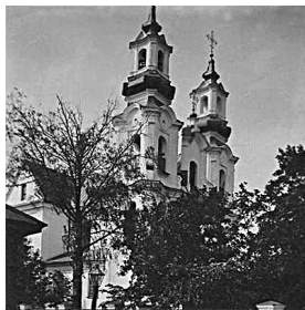
5. Vitebsko parapiinė Šv. Petro ir Pauliaus bažnyčia. XIX a. pab.