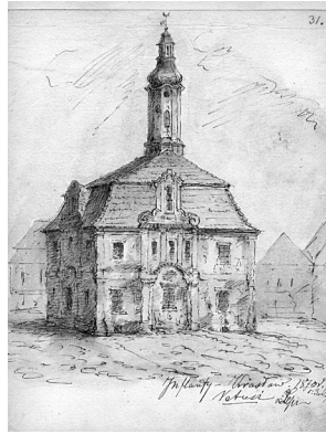
8. Kraslavos rotušė. 1870 m. Piešinys