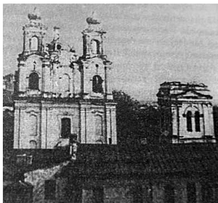
18. Mogiliavo Išganytojo Atsimainymo cerkvė. XIX a. antroji pusė