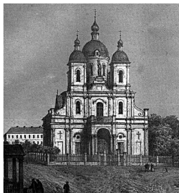
6. Bialyničų basijų karmelitų Švč. M. Marijos Škaplierinės bažnyčia

bernardinų Šv. Veronikos, Lužkų pijorų Šv. Mykolo Arkangelo, Mstislavlio karmelitų Švč. Mergelės Marijos Dangun Ėmimo, Dunilovo dominikonų Švč. Trejybės bažnyčios. Taip pat objektai, kurie neišliko iki mūsų dienų, bet jų pavidalas žinomas iš Napoleono Ordos akvarelių, litografijų ar XIX a. pabaigos – XX a. pirmosios pusės fotografijų. Tai Ilūkstės jėzuitų Švč. Jėzaus, Marijos ir Juozapo, Drujos dominikonų Šv. Antano bažnyčios, Berezvečiaus Šv. Petro ir Pauliaus bazilijonų cerkvė, Zabelių-Valyncų (lenk. Zabiady-Wohyńce ) dominikonų Šv. Jurgio, Dysnos pranciškonų Švč. Mergelės Marijos Nekaltojo Prasidėjimo, Vitebsko bernardinų Šv. Antano, jėzuitų Šv. Juozapo, parapiinė Šv. Petro ir Pauliaus bažnyčios, bazilijonų Švč. Mergelės Marijos Dangun Ėmimo ir šv. Juozapato katedra, unitų parapiinė Kristaus Prisikėlimo cerkvė, Polocko jėzuitų Šv. Stepono, Faščovkos (lenk. Faszczońka ) jėzuitų Šv. Dvasios, Bialyničų basijų karmelitų Švč. Mergelės Marijos Škaplierinės, Hubino pranciškonų Šv. Antano, Seno (lenk. Siemno ) pranciškonų Švč. Trejybės, Kubličių parapiinė Viešpaties Apreiškimo Švč. Mergelei Marijai bažnyčios, Oršos bazilijonų Švč. Dievo Motinos Globėjos, Mogiliavo stačiatikių Kristaus Apsireiškimo ir Išganytojo Atsimainymo cerkvės 5 .