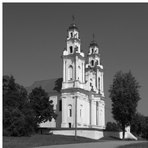
10. Pasienės dominikonų Šv. Domyko bažnyčia