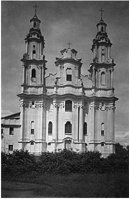
7. Bereževičiaus bazilijonų Šv. Petro ir Pauliaus cerkvė