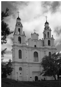
14. Polocko Šv. Sofijos katedra