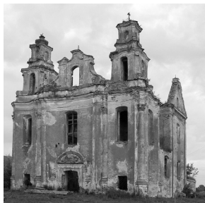
17. Smalėnų Viešpaties Apreiškimo Švč. Mergelei Marijai bažnyčia