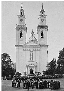
16. Polocko jėzuitų Apreiškimo Švč. Mergelės Marijai ir šv. Stepono bažnyčia. 1910 m.