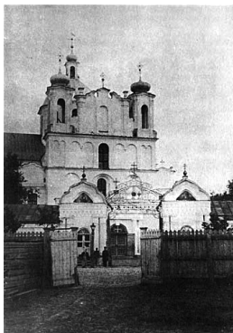
15. Mogiliavo Kristaus Apsireiškimo cerkvė