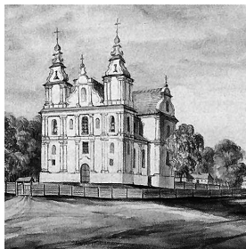
4. Faščovkos jėzuitų Šv. Dvasios bažnyčia. Napoleonas Orda. XIX a.