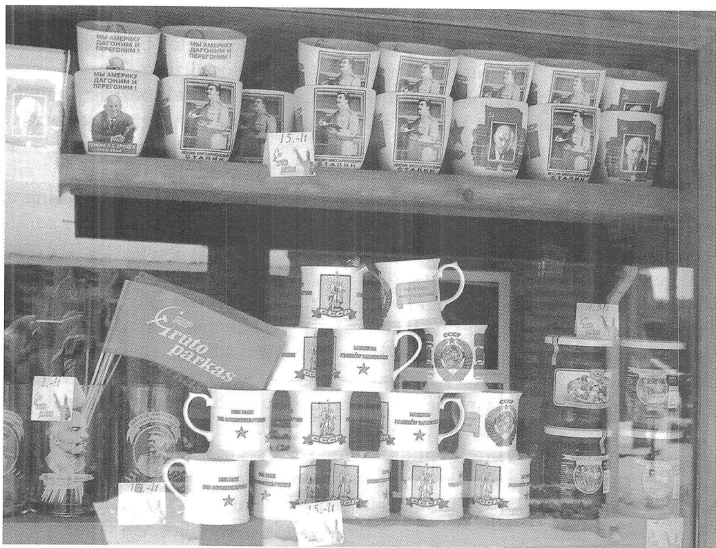
1 pav. Suprekinta socializmo atmintis.

galingesniam už juos ir už autoritarinį režimą, kuriam jie tarnavo. Grūtas leidžia lankytojams pasijusti galingiems prieš dešimtmečius juos akylai stebėjusią autoritarinę sistemą. Socialistinės valstybės persekiotas subjektas dabar gali pergalingai žvelgti jai į akis. Grūto parko kolekcija – akivaizdus įrodymas, kad ta valstybė nugalėta.