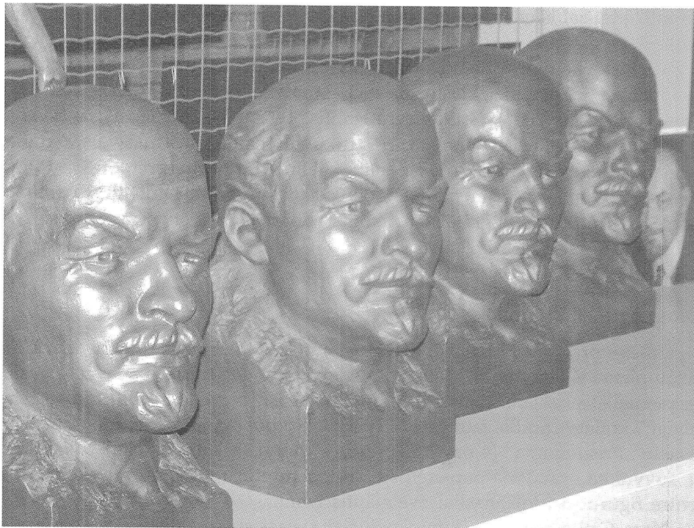
2 pav. Iljičiaus kolekcija.