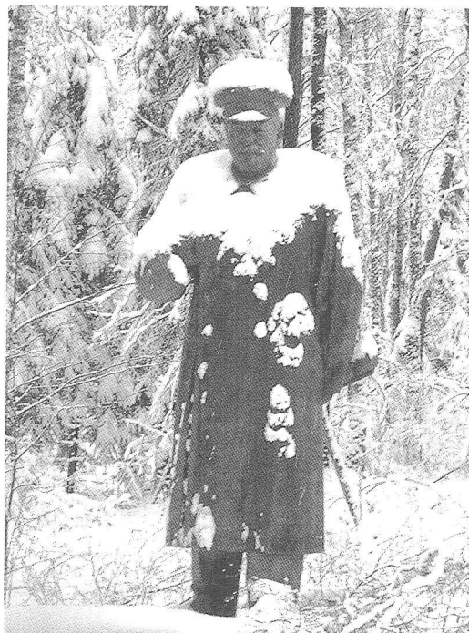
3 pav. Stalinas Grūto pusnyse.