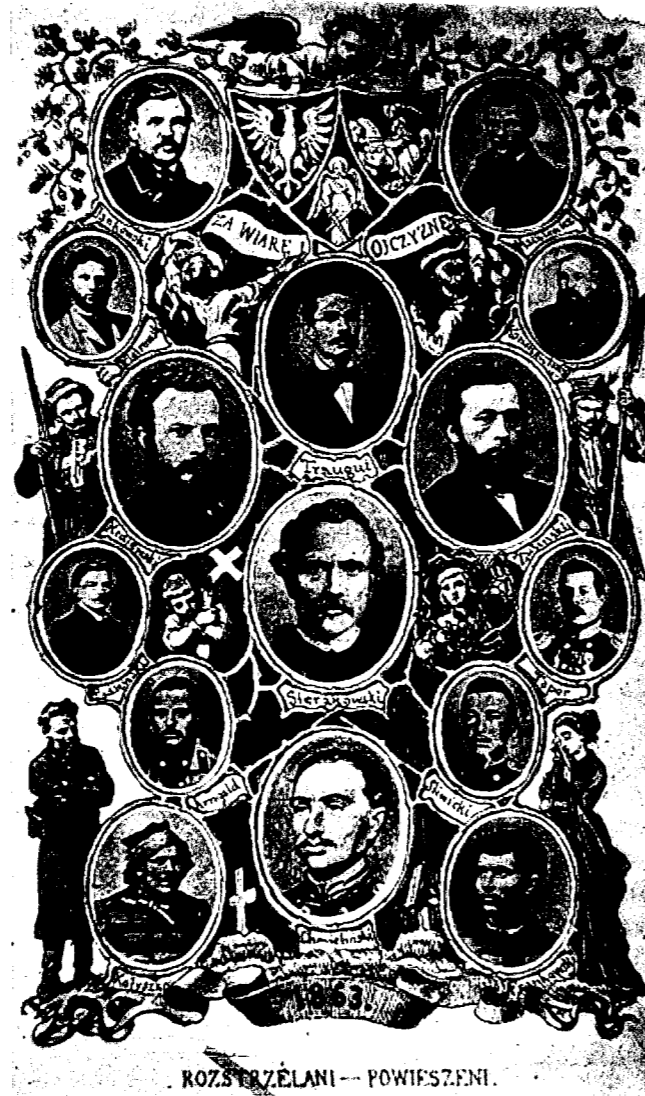
1863 m. sukilimo dalyvių, nubaustų mirties bausme, nuotraukos. Vinjetė. XIX a.

mai, grioviai užpilti žemėmis 21 . Trijų Kryžių kalnas iš tvirtovės sistemos buvo išbrauktas dar prieš tvirtovę panaikinant 22 .