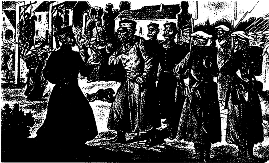
Michailas Muravjovas-korikas Vilniuje. Iliustracija iš Album powstania styczniowego 1863–1913 (Lwów, 1913)

mentas tvirtinti, kad sukilėlių egzekucijos vieta Lukiškių aikštėje yra ir jų kapavietė. Krokuvėje leistas dienraštis Czas sekmadieniniame 1863 m. birželio 14 d. numeryje publikavo pranešimą apie Vilniuje vykdomas egzekucijas. Inicialiais pasirašytos žinutės autorius informuoja apie birželio 9 d. Lukiškių aikštėje įvykdytą