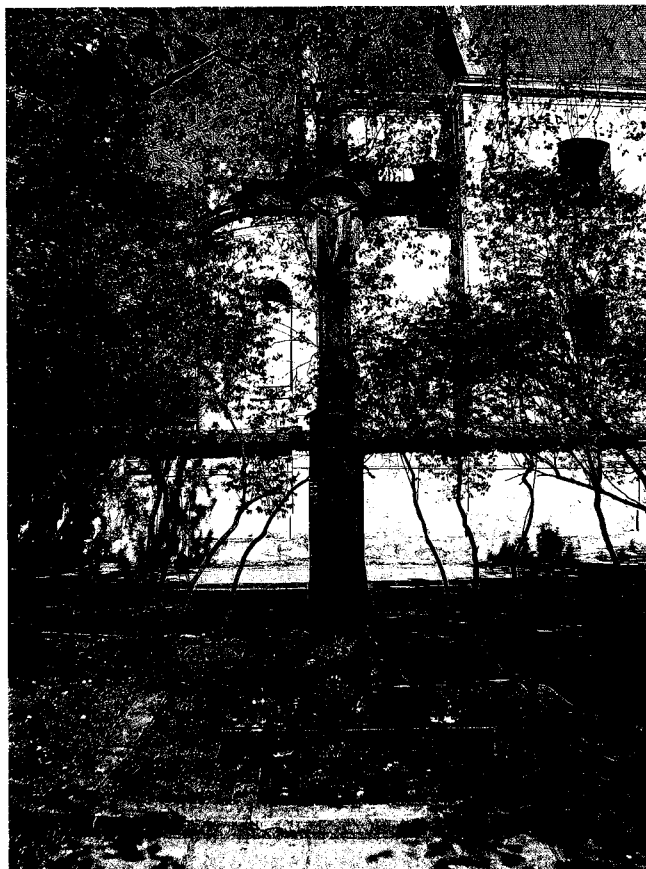
Paminklinė lenta ir kryžius 1863 m. sukilimo aukoms atminti Lukiškių aikštės pakraštyje