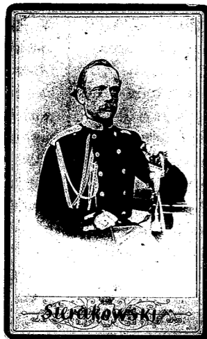
Zigmantas Sierakauskas. XIX a.

Paminklų ir atminimo lentų Lietuvoje iki šiol palyginti negausiai tesulaukęs 1863 m. sukilimas pastaraisiais metais šiuo požiūriu patiria savą renesansą. Akivaizdu, kad prie tokio sukilimo paveldo suaktualinimo ženkliai bus prisidėjusi jubiliejinė sukaktis, Lietuvoje minėta valstybiniu lygmeniu: 2013 m. buvo paskelbti Sukilimo metais. Tikėtina, kad įvairiose Lietuvos vietovėse sukilimui ir sukilėliams atminti pastatytų paminklų ir atidengtų atminimo lentų registras bus sudarytas, o sukilimo įpaminklinimo tema Lietuvoje netruks sulaukti deramo istorinės atminties tyrėjų dėmesio 1 . Šiame straipsnyje, remiantis istoriografija ir archyviniais šaltiniais, siekiama aptarti sukilimo įpaminklinimą Vilniaus mieste, susitelkiant ties jubiliejinės sukakties inspiruotais ir kol kas neįgyvendintais sumanymais naujai įamžinti vieno iškiliausių sukilimo vadų to meto Lietuvoje – Konstantino Kalinausko – atminimą. Sukilėlių atminties įpaminklinimo Gedimino kalne istorinės rekonstrukcijos kontekste keliamas klausimas apie istorinio fakto ir literatūrinio pasakojimo