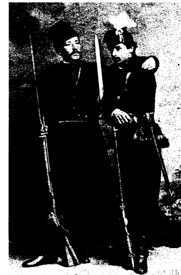
1863 m. sukilėliai. Walery Rzewusko fotografija. Iš Leszeka Machniko knygos Fotografie powstańców styczniowych (Wrocław, 2002)

Egzekucijos Lukiškių aikštėje vykdytos remiantis Rusijos imperijos kariniu Baudžiamuoju kodeksu. Str. 549-uoju reglamentuota, kad mirties bausmę įvykdžius, kūnas užkasamas egzekucijos vietoje (duobė iškasama prieš vykdytą bausmę) 8 . Pastebėtina, kad Kodekso straipsniais buvo gana smulkiai reglamentuota egzekucijos procedūra ir eiga, tik neaišku, kiek griežtai to laikytasi. Taigi įstatymo raidė nėra pakankamas argu-