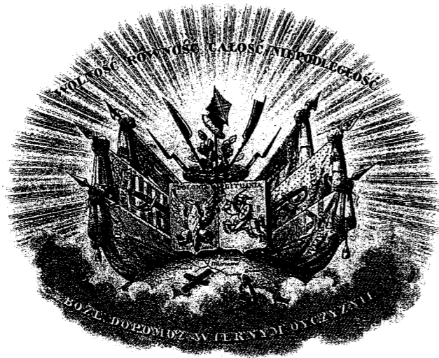
„Laisvė. Lygybė. Vienybė. Nepriklausomybė...“ Apie 1863–18644 Grafika. Iš Leszeka Machniko knygos Fotografie powstańców styczniowych (Wrocław, 2002)

Kapavietė Pilies kalne iš karto tapo lankoma – išties rudenį buvo nešamos gelės, žiemą dėti kėnių vainikai. O atėjus pavasariui plytų kryžiaus vietoje buvo pasodintos baltos, juodos ir violetinės našlaitės. Pasak Studnickio, vokiečių kareiviai 1916 m. birželio 2 ir 3 d., žaibolaidžio remonto tikslu kasdami netoliese našlaičių kryžiaus, surado žmonių palaikų liekanas. Studnickio