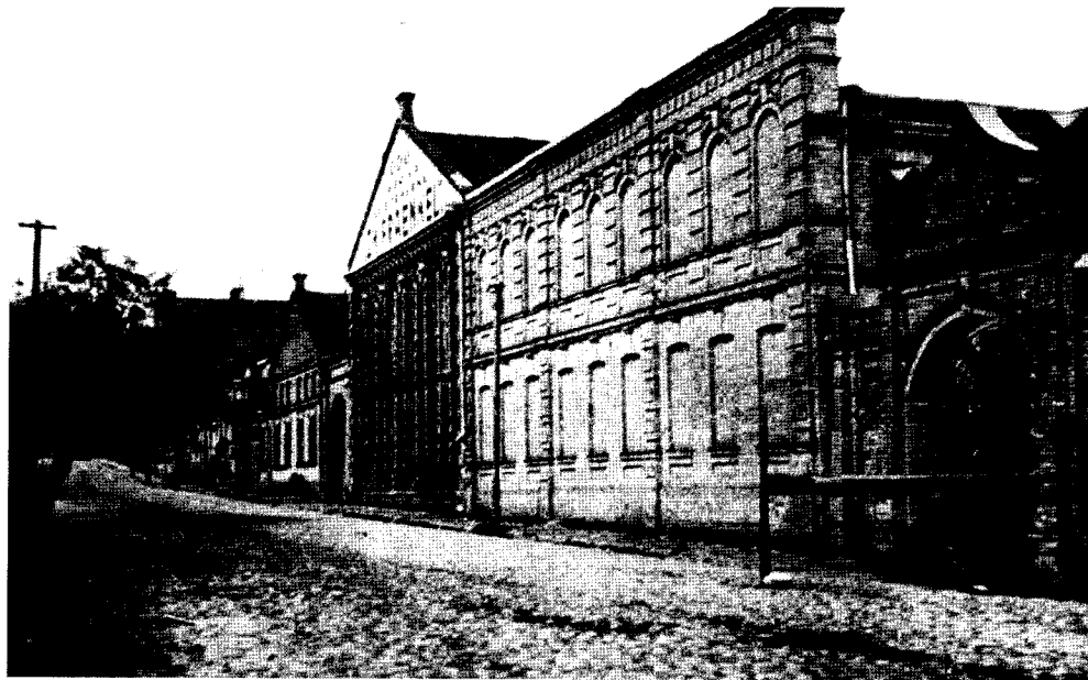
Ryc. 2. Fabryka wyrobu skór Chaima Frenkiela.